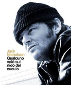
Jack Nicholson Qualcuno volò sul nido del cuculo